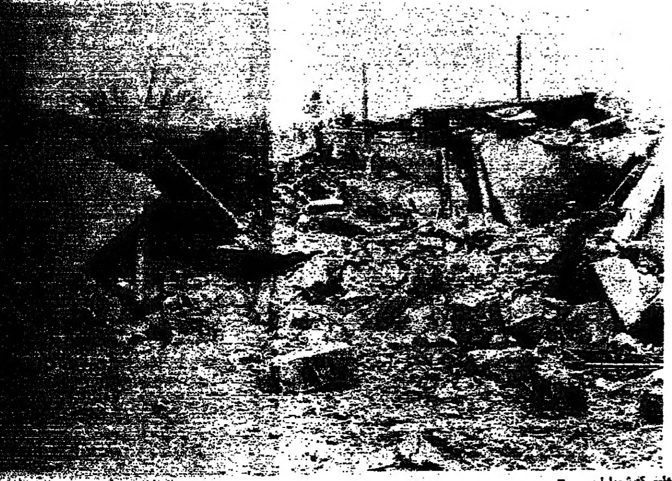
منازل تحولت الى ركام بعد العدوان الإسرائيلي الوحشي على كفرشوبا امين